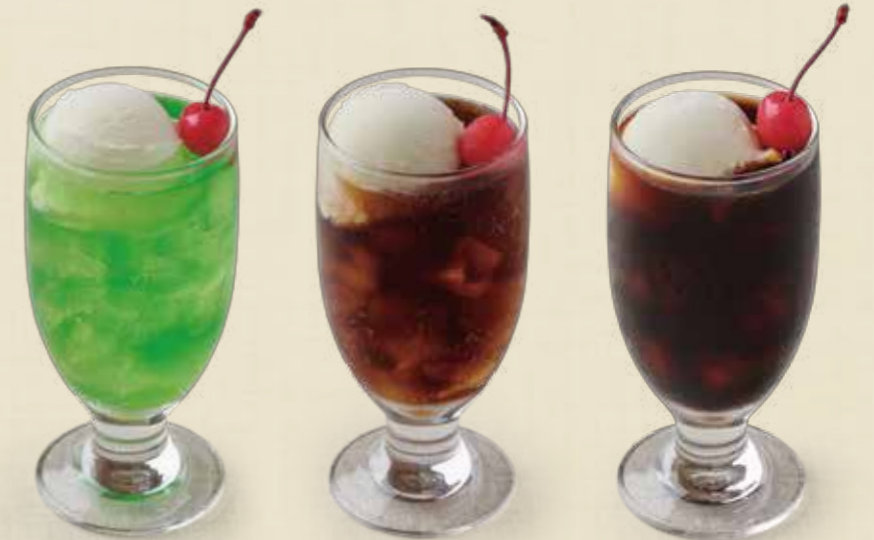
メロンクリームソーダ コーラフロート コーヒーフロート